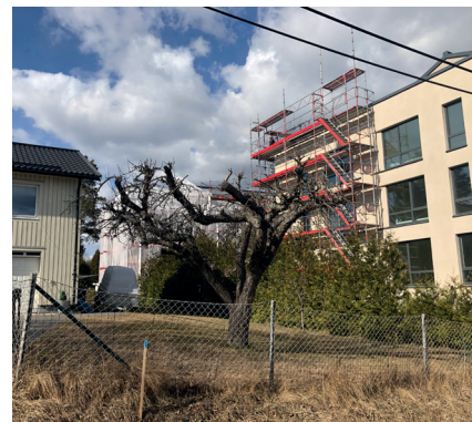
En av de nya byggnaderna i Södergården som uppförts utan respektavstånd till närliggande villor.

De nya kvarteren i Södergården som nu växer fram representerar inte den vision Liberalerna har för centrumstråket. Dessa byggnader är enligt oss både för höga och kompakta, och saknar respektavstånd till de närboende.