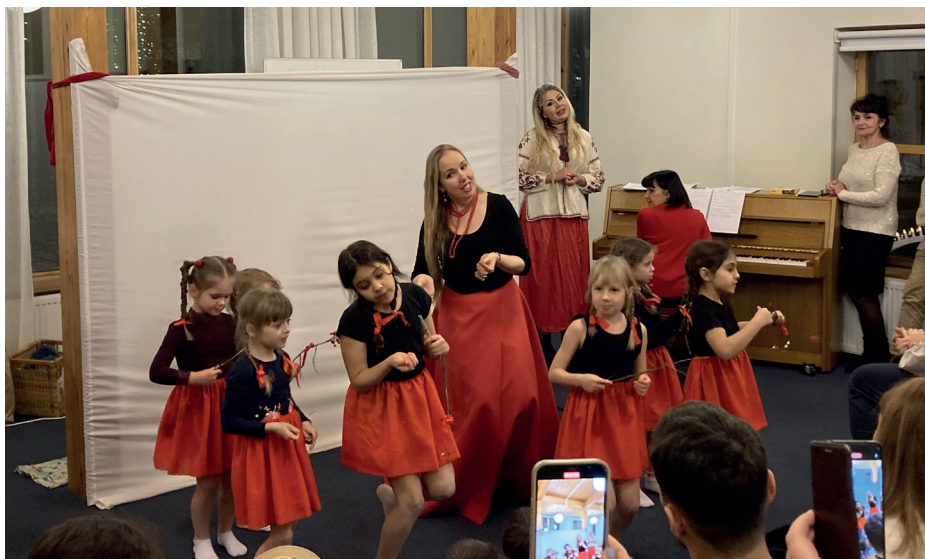
Sång- och dansföreställning av en del av Tyresös ukrainare i samband med julfirandet den 6 januari.